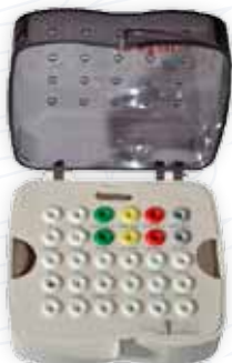
Tray autoclavabile small