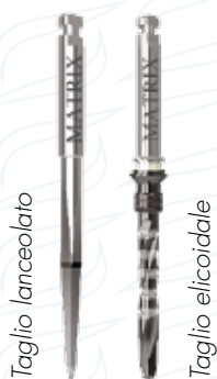
Frese iniziali Performance