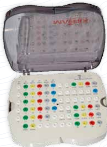
Tray autoclavabile big