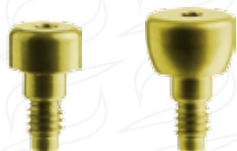
Pilastro di guarigione dritto e svasato short serie "PGS2D" e "PGS3S"

Per una corretta guarigione della gengiva nell'attesa dell'applicazione della componente protesica su impianto endosseo.