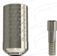
Pilastro flat interno in titanio da saldatura serie "SPTRS" e "SPTRS 7"