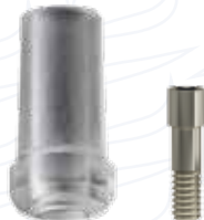
Pilastro calcinabile spalla interna short serie "CSIS" e "CSIS 7"

Essendo personalizzabili dall'operatore possono essere parzialmente o totalmente ceramizzabili.