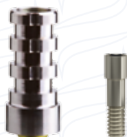
Pilastro ritentivo rotazionale in titanio short serie "KPTRS" e "KPTRS 7"