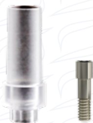
Pilastro calcinabile short serie "CEIS" e "CEIS 7"

Essendo personalizzabili dall'operatore possono essere parzialmente o totalmente ceramizzabili.