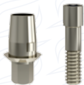
Pilastro antirotazionale ad uso digitale in titanio serie "TB"