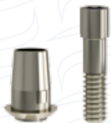
Pilastro rotazionale ad uso digitale in titanio serie "RTB"