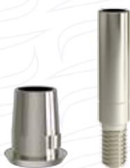
Cappetta "CMFT TB" ad uso digitale per monconi flat serie "MCF"