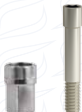
Connettore esagono interno torque esterno