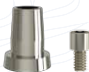
Cappetta ad uso digitale "ICP TB" per monconi conici serie "MC"