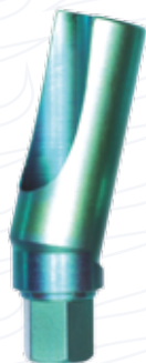
Pilastro di parallelismo a 15° in titanio antirotazionale serie "P"