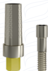
Pilastro provvisorio in titanio serie "PT"