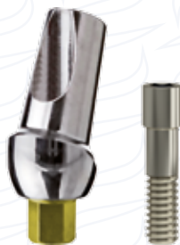
Pilastro angolato 15° o 25° serie "15" e "25"