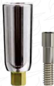
Pilastro personalizzabile per fresaggio serie "PF"