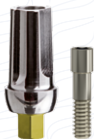
Pilastro dritto serie "2D" e "5D"