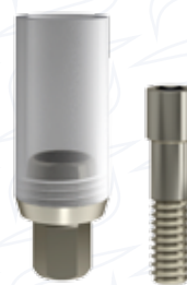
Pilastro per sovrافusione in Co.Cr.Mo. serie "UCLA C"

Essendo personalizzabili dall'operatore possono essere parzialmente o totalmente ceramizzabili.