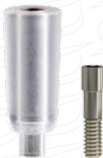
Pilastro calcinabile da fresaggio serie "CFI"

Essendo personalizzabili dall'operatore possono essere parzialmente o totalmente ceramizzabili.