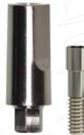
Pilastro dritto senza spalla serie "DD"