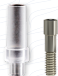
Pilastro calcinabile serie "CEI"

Per creare le condizioni ottimali estetiche e funzionali per la realizzazione del dispositivo finale.