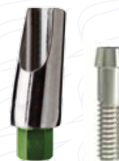
Pilastro angolato 15° o 25° senza spalla serie "15D" e "25D"