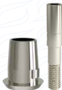
Cappetta ad uso digitale per monconi conici flat serie "EMCF"