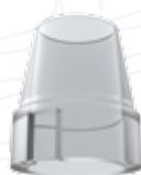
Cappetta calcinabile antirotazionale ad uso digitale per pilastri e cappette serie "TB"