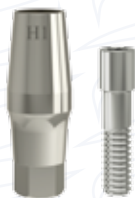
Pilastro dritto serie "E_D A"