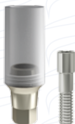
Pilastro da sovrافusione in Co.Cr.Mo. serie "EUCLA C"

Per creare le condizioni ottimali estetiche e funzionali per la successiva realizzazione del dispositivo finale.